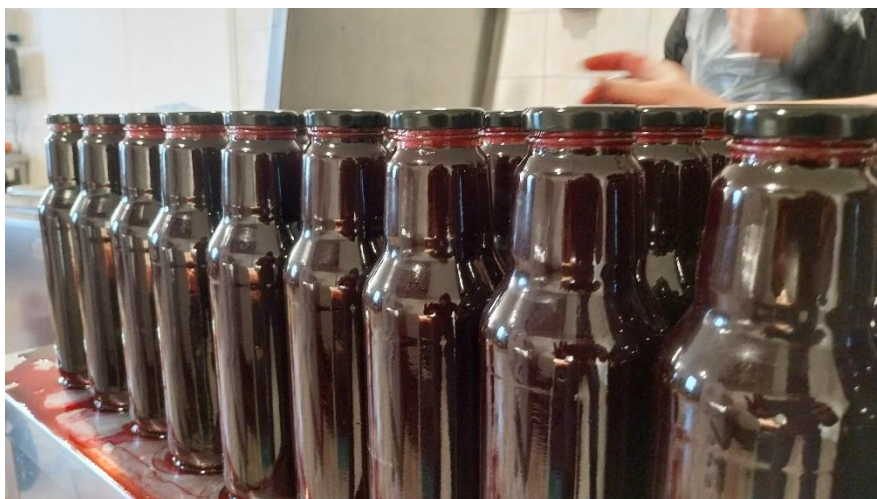
11. ábra 100% céklalé

A termékek korszerű jelölését a beszerzett címkenyomtató segítségével, külső szolgáltatás igénybevétele nélkül tudjuk megvalósítani. A külső nyomdai szolgáltatással szemben a kis szériaszámú változó tartalmú címkék nyomtatása biztosítja a hatékonyságot.