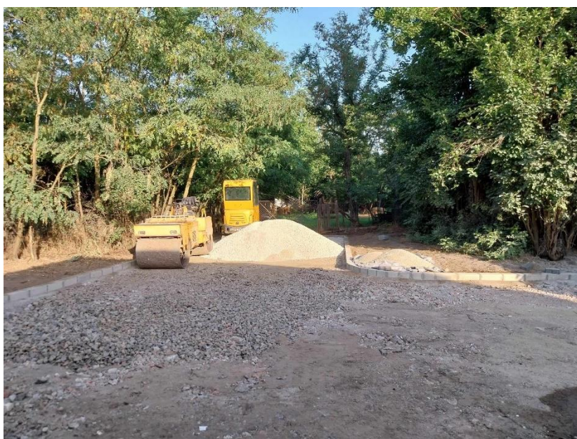
8. ábra Építési munkálatok.