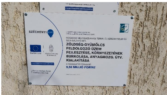
5. ábra Projekttábla.

Az üzem környezetének burkolattal való kiépítése megkönnyíti az anyagmozgatást. Az anyagmozgatási és személyi közlekedési útvonalak területe körülbelül 500 négyzetméter, amelyből 380 négyzetméter kőburkolat, 120 négyzetméter beton burkolat. A burkolat kihagyásokkal tartalmaz növényekkel betelepíthető kertrészeket, illetve meghagyja a tradíciós szomorú és jegenye eperfákat. A burkolatok kivitelezési munkálatait teljes egészében az Imrei István Kft. végezte el, amely kivitelező HACS térségi vállalkozó. A kivitelezés során igénybe vettünk műszaki ellenőri szolgáltatást, így a kivitelezés az eredeti terveket és előírásokat betartva valósult meg. A szilárd burkolat lehetővé teszi a termékek tömeges mozgatását, a feldolgozó üzem berendezéseinek egyszerű változtatását, és az alapanyagok megfelelő helyre vitelét.