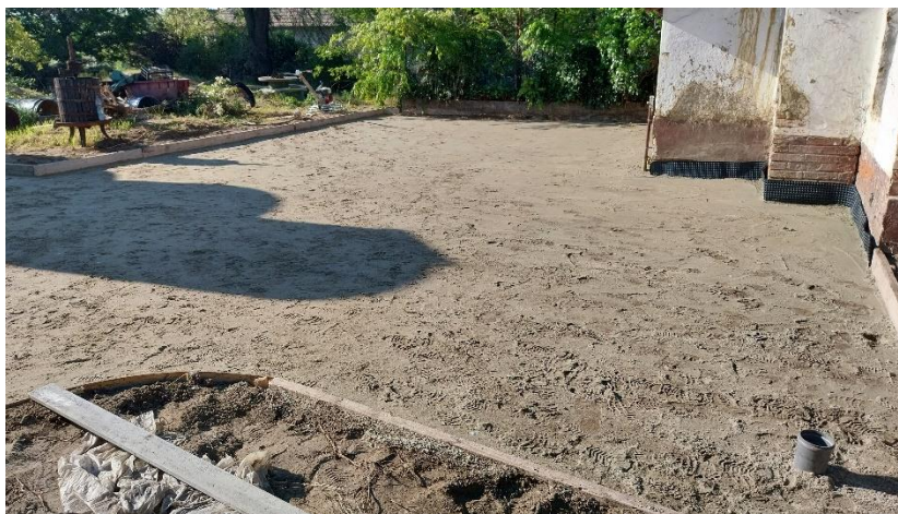
6. ábra Építési munkálatok.

Az üzem környezetének burkolattal való kiépítése megkönnyíti az anyagmozgatást. Az anyagmozgatási és személyi közlekedési útvonalak területe körülbelül 500 négyzetméter, amelyből 380 négyzetméter kőburkolat, 120 négyzetméter beton burkolat. A burkolat kihagyásokkal tartalmaz növényekkel betelepíthető kertrészeket, illetve meghagyja a tradíciós szomorú és jegenye eperfákat. A burkolatok kivitelezési munkálatait teljes egészében az Imrei István Kft. végezte el, amely kivitelező HACS térségi vállalkozó. A kivitelezés során igénybe vettünk műszaki ellenőri szolgáltatást, így a kivitelezés az eredeti terveket és előírásokat betartva valósult meg. A szilárd burkolat lehetővé teszi a termékek tömeges mozgatását, a feldolgozó üzem berendezéseinek egyszerű változtatását, és az alapanyagok megfelelő helyre vitelét.