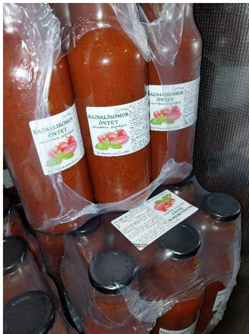
10. ábra Bazsalikomos paradicsom öntet.