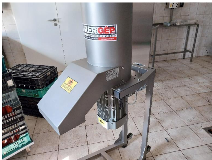
1. ábra Gyümölcstaráló

A Zöldség-gyümölcs feldolgozó üzem fejlesztés során új eszközöket szereztünk be (gyümölcstaráló, aszalószekrény, töltőgép, címkenyomtató), amelyek segítségével új termékváltozatok bevezetése váltak lehetővé, és a feldolgozási folyamatok hatékonyabbá. A gyümölcstaráló (MKDL 1000 Daráló) lehetővé teszi új gyümölcsök, zöldségfélék feldolgozását (például cékla, alma). Az aszalószekrényrel (MKASZ 25) új típusú feldolgozás (aszalás, szárítás) lehetséges az eddigi alapanyagokból. Aszalt paradicsom készítése valósul meg az aszalószekrény segítségével. A töltőgép (MKLT 100 Lekvártöltő) hatékony töltést eredményez. Paradicsomlevet, kevert sűrítményeket (bazsalikomos, és erős paprikás öntet) töltünk vele. A töltés során azt tapasztaltuk, hogy a gép segítségével gyorsabban és pontosabban lehet megtölteni a termékekkel az üvegeket.