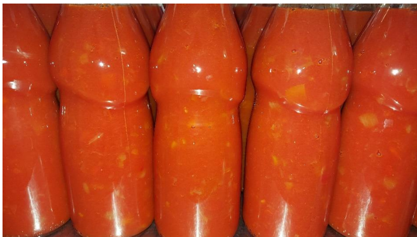
10. ábra Erőspaprikás paradicsom öntet.