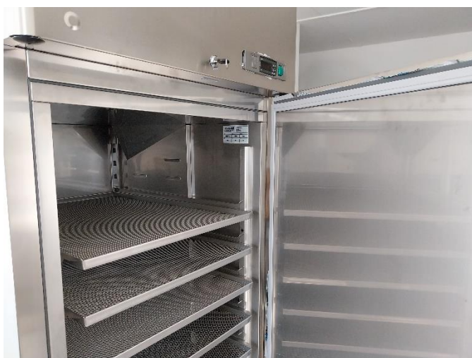
2. ábra Aszalószekrény