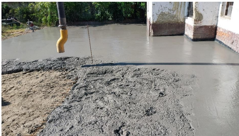
7. ábra Építési munkálatok.