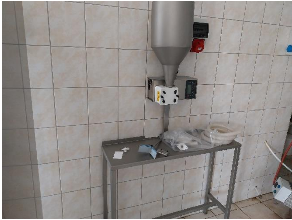
3. ábra Lekvártöltő

A termékjelölés problémájának megoldására egy címkenyomtatót vásároltunk. A nyomtató (Epson ColorWorks CW-C6000AE) legfőbb tartozéka a feltekerceselő (RW6000A Feltekerceselő) és a kezelő szoftver (Nice Label designer szoftver) A nyomtatót tartozékaival együtt használva – a meglévő címke felragasztó géphez alkalmas – színes korszerű címketekercseket tudunk készíteni.