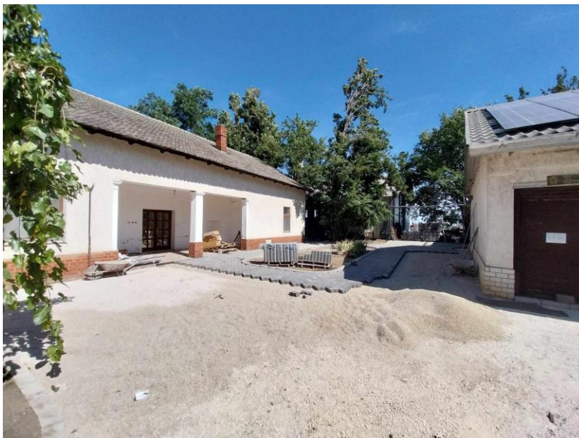
9. ábra Építési munkálatok.

Zöldség-gyümölcs feldolgozó üzem fejlesztése során beszerzett eszközök a következő termékek gyártását tették lehetővé: