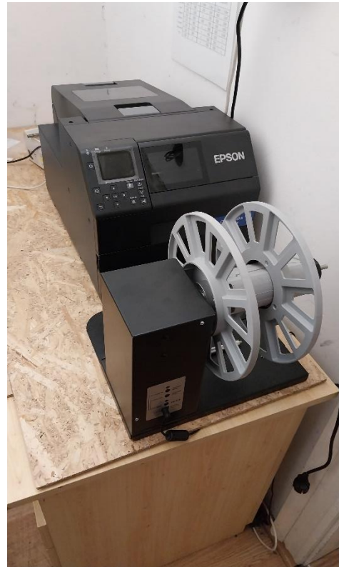
4. ábra Címkenyomtató és feltekerceselő

A termékjelölés problémájának megoldására egy címkenyomtatót vásároltunk. A nyomtató (Epson ColorWorks CW-C6000AE) legfőbb tartozéka a feltekerceselő (RW6000A Feltekerceselő) és a kezelő szoftver (Nice Label designer szoftver) A nyomtatót tartozékaival együtt használva – a meglévő címke felragasztó géphez alkalmas – színes korszerű címketekercseket tudunk készíteni.